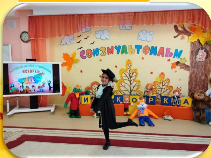
д/с № 47 «Лесная сказка» «Сольное пение»