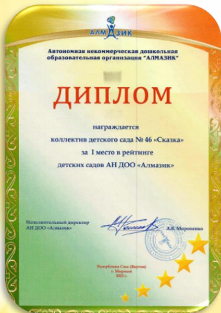
ДИПЛОМ I МЕСТО В РЕЙТИНГЕ детских садов АН ДОО «Алмазик» Коллектив детского сада № 46 «Сказка»