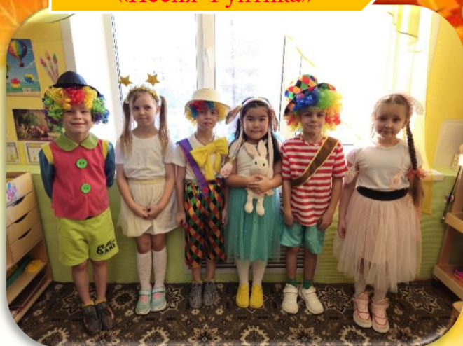
д/с № 1 «Оленёнок» «Песня Фунтика»