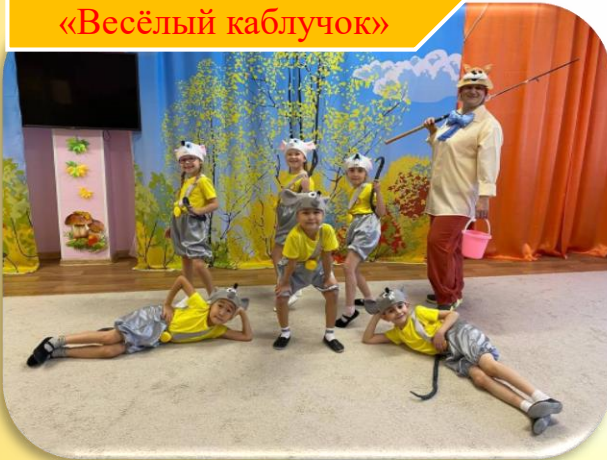
д/с № 37 «Звездочка» «Весёлый каблучок»