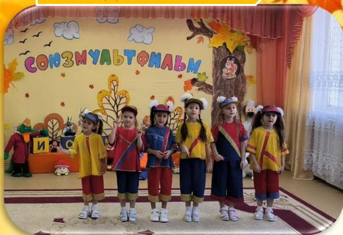
д/с № 51 «Улыбка» «Домисолька»