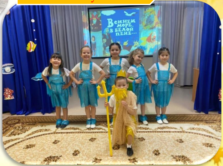
д/с № 6 «Березка» «Сами с усами»