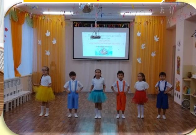
д/с № 3 «Золотой ключик» «Радуга»