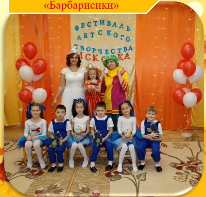
д/с № 46 «Сказка» «Барбарисики»