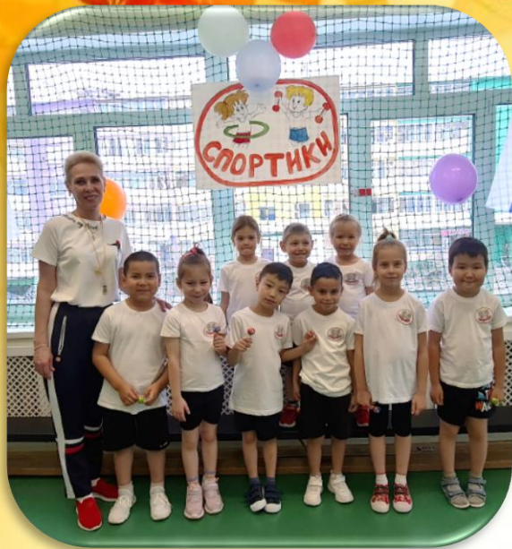
Команда «Спортики» Участие в

Детских олимпийских играх среди детских садов АН ДОО «Алмазик»