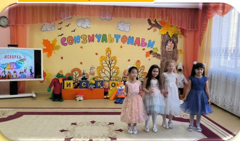
д/с № 51 «Улыбка» «Веснушки»