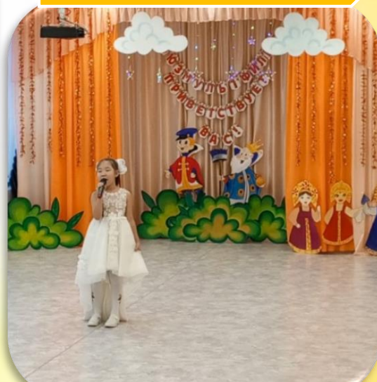
д/с № 14 «Медвежонок» «Сольное пение»