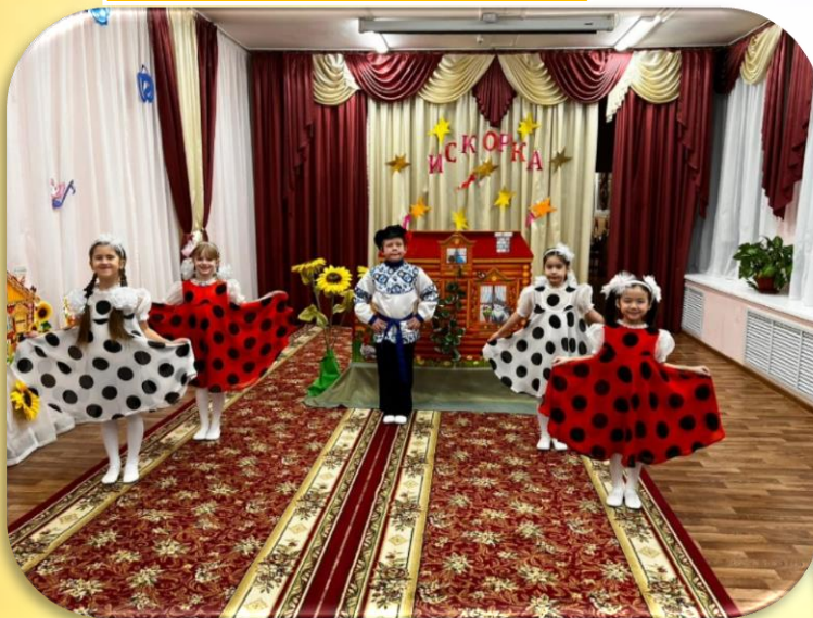
д/с № 2 «Сардаана» «Чудо дети»