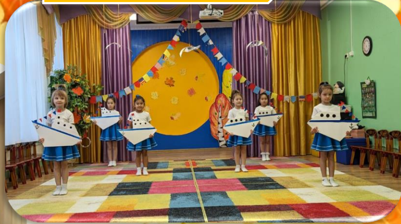
д/с № 12 «Солнышко» «Жемчужинки»