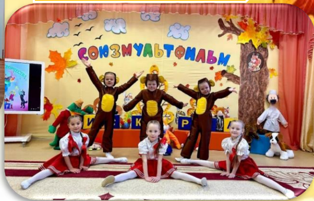
д/с № 50 «Нордик» «Звездопад»