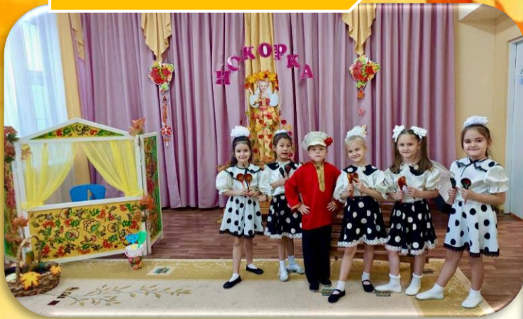
д/с № 50 «Белоснежка» «Изюминка»