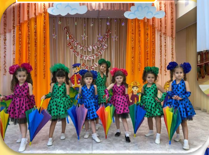
д/с № 14 «Медвежонок» «Карамелька»